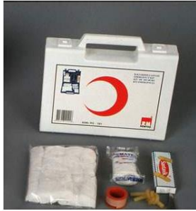
İLK YARDIM ÇANTASI