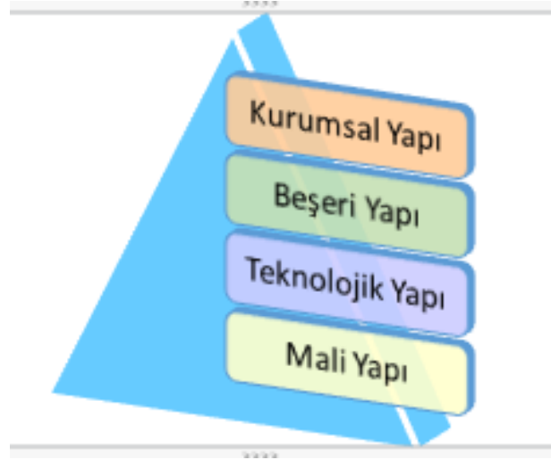
Şekil 2: Kurum İçi Analiz Alt Başlıkları

Çalışanlara yönelik anket sonuçları bu bağlamda değerlendirildiğinde, istenilen düzeyde gerçekleşmeyen boyutlar tespit edilmiştir. Buna göre kurum kültürünü oluşturan öğelerden iletişim, bütünleşme, ödül sistemi ve yönetim iyileştirmeye açık desteği konuları alan olarak belirlenmiştir.